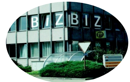
BIZ / Beratungs- und Informationszentrum